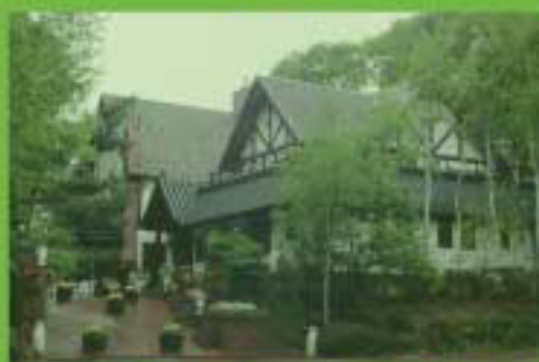
メイン会場・宿泊：清里高原ハイランドホテル (山梨県北杜市)